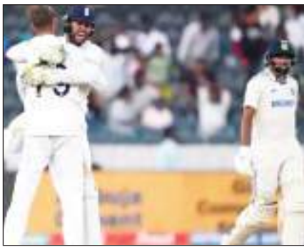
हैदराबाद टेस्ट में टीम इंडिया की करारी हार: पहले मैच में इंग्लैंड ने 28 रन से जीत दर्ज कर ली है।