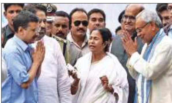
अलग होने की कहानी को मजबूत आधार दे दिया। जानकारी के मुताबिक चार महीने से चल रही अंदरूनी उठापटक का नतीजा

टीम एक्शन इंडिया/पटना विपक्षी दलों के गठबंधन 'इंडिया' के दरकने और नीतीश कुमार के अलग होने की पटकथा सितंबर से ही लिखी जाने लगी थी। लेकिन इस पटकथा को मजबूती दिसंबर में तब मिली जब पश्चिम बंगाल की मुख्यमंत्री ममता बनर्जी ने एक बड़ा दांव खेल दिया। जानकारी के मुताबिक इस दांव के तहत केजरीवाल और ममता बनर्जी ने कांग्रेस के अध्यक्ष मल्लिकार्जुन खरगे को गठबंधन का चेहरा बनाकर पेश किया। इस पेशकश के साथ सितंबर में लिखी जाने वाली नीतीश कुमार के गठबंधन से